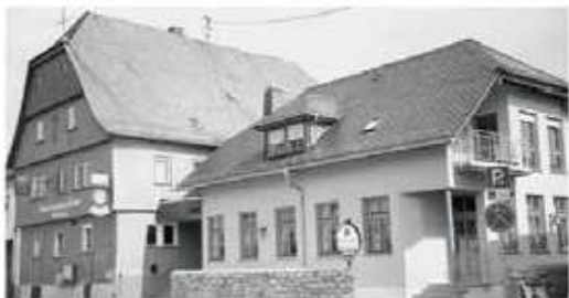
Gasthaus »Zum Steinernen Haus« Hüttenberg Inhaber: Rolf Jung